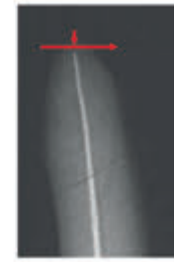
X ray filmi yetersiz dolgu gösteriyor

Tutuş hissine ve hastanın ağrısına bağlı olarak diş hekimleri, ölçüm aletinin yüksek sübjektiflik ve düşük doğrulukla apikal foramenlere ulaşip ulaşmadığına karar verir. Yabancı literatür, +0.5 mm hata aralığı sağlayarak, işleme yönteminin doğruluğunun sadece %42 olduğunu göstermektedir.