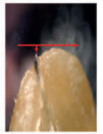
Aslında fazla doldurulmuş.