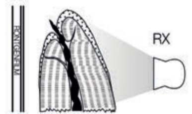
Apikal foramen yan kenardadır, X ray çekimi hata uzunluğuna daha büyük hata ve daha ciddi aşırı doldurma neden olur.

Apikal foramenler X ışını dosyasında gösterilemez, çünkü %80'den fazla apikal foramen apeks yerine yan kenardadır.